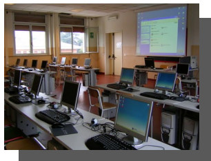
n. 2 aule informatiche multimediali