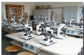
n. 1 aula di microscopia e scienze