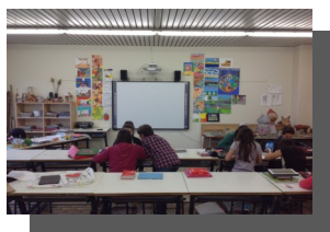
n. 1 aula di arte e immagine