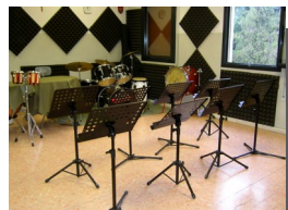
n. 3 Laboratori musicali