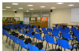
n.1 aula magna multimediale n.1 sala insegnanti n. 1 sala riunioni n. 1 sala ristoro

Tutte le aule sono dotate di Lavagna Interattiva Multimediale