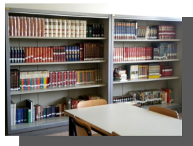
n. 1 biblioteca completa di libri, strumenti didattici anche per alunni in difficoltà